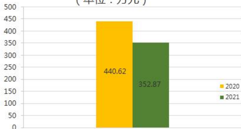
收入支出决算总计变动情况表 (单位：万元)

2021 年度收、支总计 352.87 万元。与 2020 年度相比，收、支总计各减少 87.75 万元，下降 19.92%。主要是因为人员考核奖经费减少。