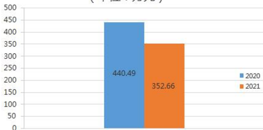
财政拨款收入支出决算总计变动情况 (单位：万元)

2021 年度财政拨款收、支总计 352.66 万元。与 2020 年度相比，财政拨款收、支总计各减少 87.83 万元，下降 19.94%。主要是人员奖金经费减少。