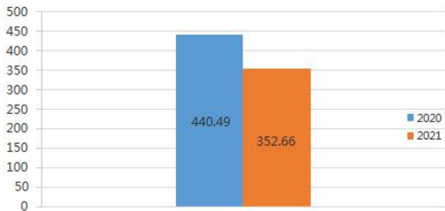
一般公共预算财政拨款支出决算情况 (单位：万元)